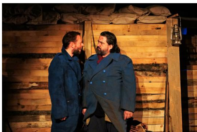
On se jette ses raisons à la figure.

À quelques heures de la clôture des Insolites/Originales, la compagnie de l'Ourdi proposait sa création théâtrale « Les Sources sous les ronces ». Un beau public a accueilli sous le préau de l'ancien lycée Chappe cette performance avec curiosité et intérêt.